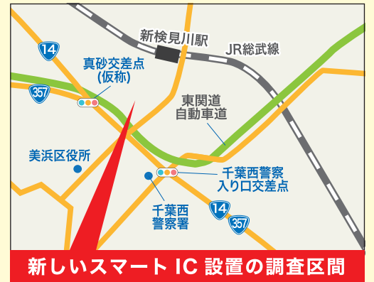
新しいスマートIC 設置の調査区間