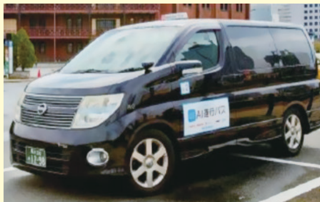
▲車両、バス停イメージ

この度、株式会社NTTドコモ(株式会社ドコモCS千葉支店)が本事業を活用し、幕張新都心エリアに置いて、以下3つの実証実験を行い、次世代モビリティサービスの事業化に向けた課題の抽出や、車両技術等の検証を実施しますのでお知らせします。