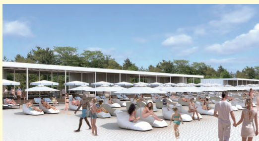
③BEACH HOUSE イメージ図