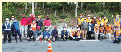
▲第3回 国道357号側道での清掃活動の様子