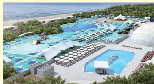
②プール イメージ図