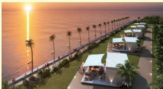
①VILLA HOTEL イメージ図

新型コロナウイルスの影響で、営業開始時期が延期される等ありましたが、今回の整備により、稲毛海浜公園がさらに市民に愛される公園となり、同時に、市外の方にも利用して頂き「稼げる」施設となることを願っています。