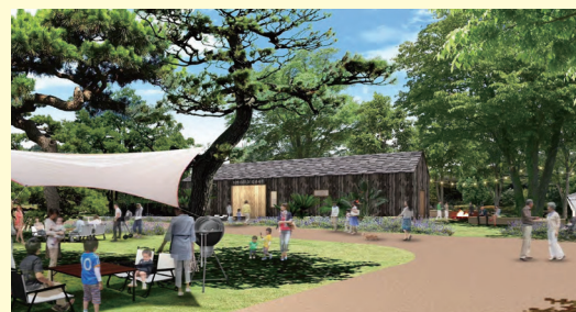
④BBQ PARK イメージ図