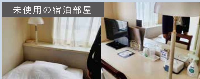
未使用の宿泊部屋

管理室では最新情報を含め壁に掲示して、関係者が状況をすぐ把握できるよう工夫し、館内は24時間監視カメラによるチェックも行なわれております。