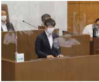
感染防止対策を講じた7月臨時議会。